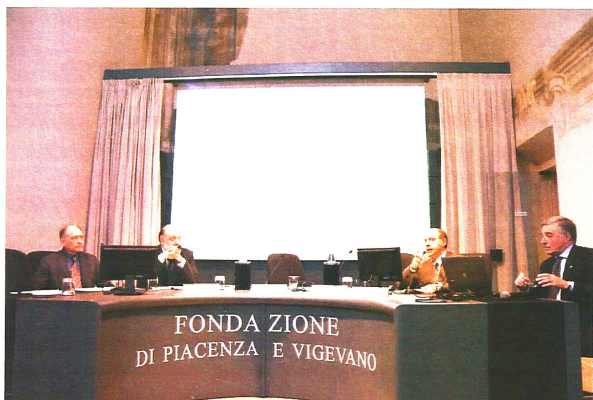
In copertina: Samuel Luke, Il medico (1981)